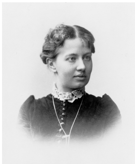
Софья Васильевна Ковалевская

Bei meinen Recherchen stieß ich auf ein mir bis dahin unbekanntes Foto Kowalewskajas, das aus dieser ersten Zeit in Stockholm stammt (Abb. links). Ich fand es in Berlin in dem Fotoalbum, das Weierstraß zum 70. Geburtstag überreicht wurde, und im Institut Mittag-Leffler. Beide tragen keine Datierung. Dank glücklicher